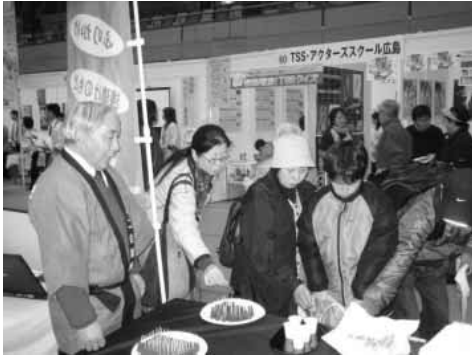
広島で開催された島根ふるさとフェア

この事業に掛かる経費は、いろいろと制限はありますが、基本的には、国からの補助金で実施しました。また、補助金申請から展示会等に至るまでの一連の