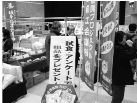
雲州ひらた大物産展

広島ふるさとフェアに参加した時のアンケートで、出雲のお茶の知名度が意外にも高くびっくりしましたし、自信にもなりました。会議所が中心とな