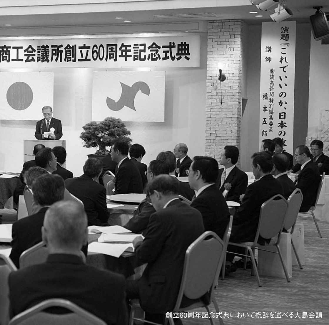
創立60周年記念式典において祝辞を述べる大島会頭

当商工会議所では、去る10月3日にホテルほり江において、創立60周年記念式典を開催し、平田地域商工業の更なる発展に貢献することを誓った。