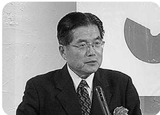
創立60周年記念式典において祝辞を述べる西尾市長