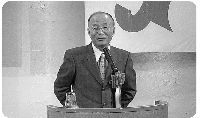
記念講演会「これでいいのか日本政治」で講話を行う読売新聞特別編集委員橋本五郎氏