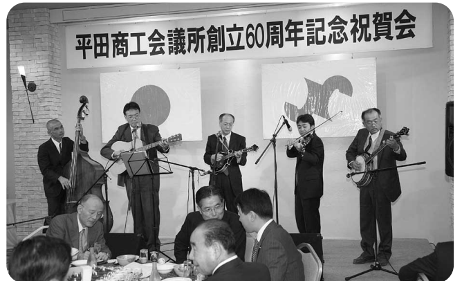
記念祝賀会におけるアトラクション「バンド虫」による生演奏