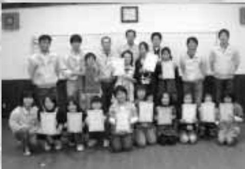
修了証を手にとっこり☆頑張ったね♪

本事業は、今年度の平田YEGスローガン「育 そだてる・はぐくむ」に基づき、平田地域内の小学校に通う児童に「ビジネス体験」や「ものづくり体験」を通じて、自由な発想や創造性を高めてもらい、子供たちのアントレプレナーシップ（起業家精神）を醸成することを目的としています。