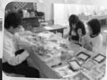
製作は真剣そのものです。