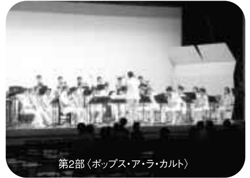
第2部〈ポップス・ア・ラ・カルト〉

演奏会終了後には、平田地域3中学校の吹奏楽部への指導会も行われ、参加した生徒の皆さんには有意義な時間を過ごすとともに、自衛隊を身近な存在に感じる機会になったようでした。