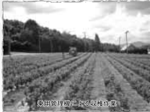
乗用管理機による収穫作業