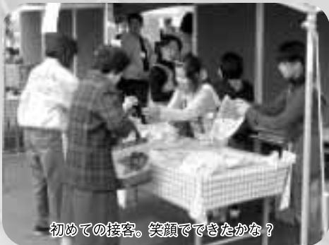
初めての接客。笑顔でできたかな？

平田地域に13ある小学校の5・6年生を対象に募集を行ったところ、平田小7名・東小3名・西田小3名の総勢13名が参加。