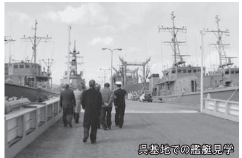
呉基地での艦艇見学