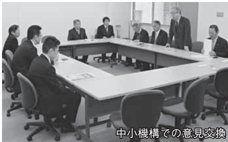
中小機構での意見交換

19日には、海上自衛隊呉地方総監部訪問を前に、同隊への理解を深めるため江田島市の海上自衛隊第1術科学校を見学しましたが、