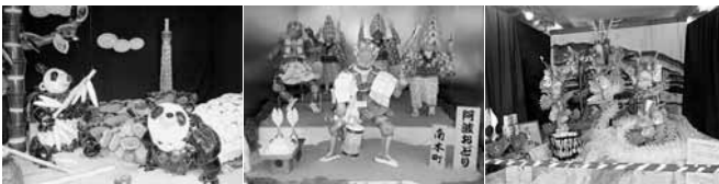
準特選 「上野のパンダ」 準特選 「阿波おどり」 一式飾アイデア賞 「オロチ君」

7月20日、平田天満宮祭奉納一式飾競技大会が開催され、本年は西町町内製作の「フラメンコ」が特選に選ばれました。