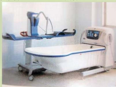
県下初スウェーデン製特浴でリラックス