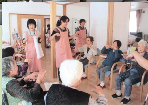
楽しくレクリエーション