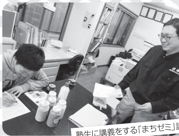
塾生に講義をする「まちゼミ」講師

去る11月1日から30日までの間、平田町の商店を中心に「ひらたdeまちゼミ」が開催されました。参加店19店舗、20講座によるものづくり体験や知識習得等の様々な講座が開かれ、各店舗それぞれに応募された塾生の対応に追われました。「自店のファンづくり」として各店舗の専門分野の知識や技術を無料で教える「まちゼミ」。今後は、今回開催のアンケート調査結果等を踏まえ、さらなる「ファンづくり」に取り組んでいく予定です。