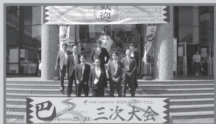
中国ブロック大会三次大会にも参加してきました！