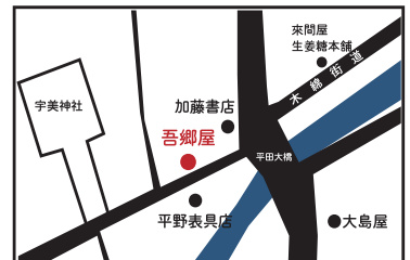
※表紙デザイン・会報タイトル切り抜き：吾郷屋

出雲市平田町721 電話 050-5207-6900 営業時間 13:00~19:00 定休日 火曜日・水曜日 https://www.facebook.com/agouya/ Mail: notebookagouya@gmail.com