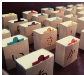
手製本・紙の造形