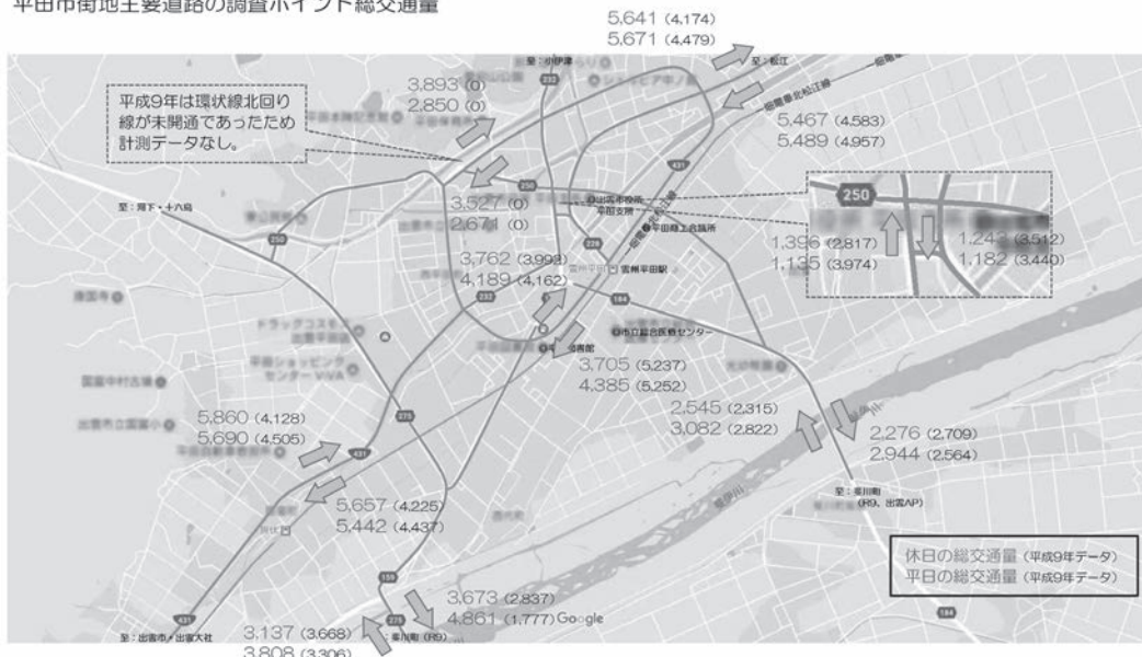
平田市街地主要道路の調査ポイント総交通量

詳しい報告書につきましては当所HP( www.hirata-cci.or.jp )に掲載しておりますのでご覧ください。