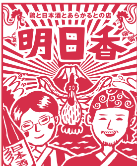
鶏と日本酒とあらかるとの店