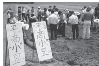
出雲産あずき商品開発