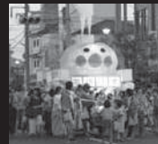
天の川賞 平田青年会議所