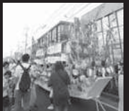
織姫賞 平田コミュニティセンター