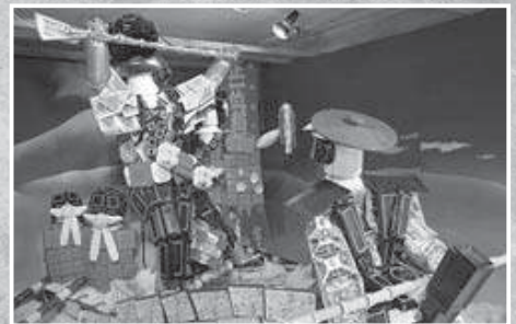
〔特選〕宮ノ町「日本三大船神事ホーランエンヤ」