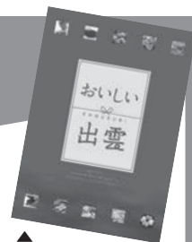
ガイドブック表紙デザイン(第2期)

認定された商品は、認定委員会において積極的に情報発信や販促活動を行い販路拡大を支援します。