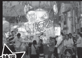
特選七夕賞 西郷町