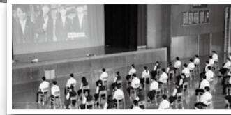
ガイダンスの様子

平田高校プラタナスプラン： https://www.hirata-h.ed.jp/career/platanus-plan/