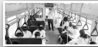
一畑電車内での講話