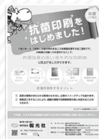
(株)報光社 抗菌印刷