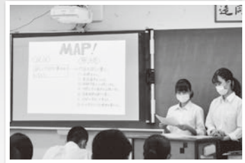
2年生中間発表会の様子

7月下旬、クラスごとに1学期の探究の成果をまとめ、「多文化共生社会の推進」「木綿街道の活用」「空き家の再生」「一畑電車の魅力発信」等をテーマに中間発表会を行いました。また、「出雲産あずきを使った商品化」についても地元企業の方の助言をいただきながら進めています。