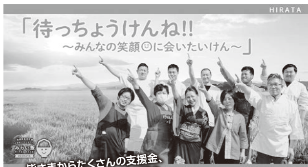
「待ちちょうけんね!! ～みんなの笑顔◎に会いたいけん～」 皆さまからたくさんの支援金、温かい応援メッセージを頂きありがとうございました!!

(店舗指定コースを選択された方は、みらい飯食事券が 8月3日(月) よりご利用可能となっています。指定された店舗でのお引替えをお願いします。)