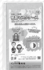
(株)報光社 紙製マスクケース

※ROLLING STOCK：非常食の保存管理方法。非常時に備え少し多めの食料を備えておき、定期的に消費・補充することで、備蓄した非常食が消費期限切れとなるのを防ぐ。