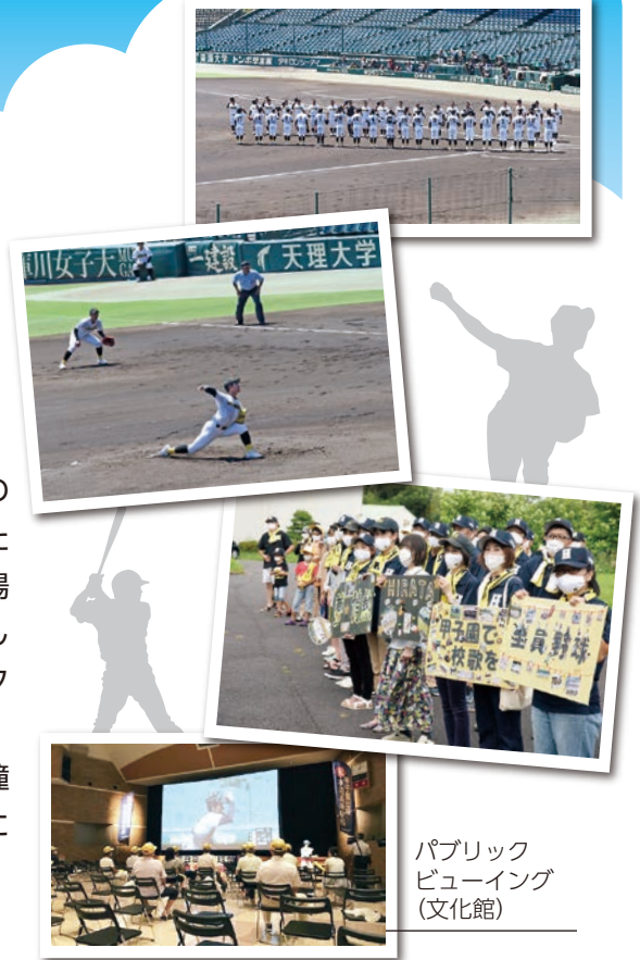
パブリック ビューイング (文化館)