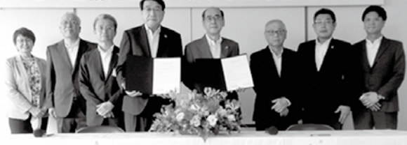
公立大学法人島根県立大学と平田商工会議所との包括的連携に関する協定書調印式

これまででも会員企業が県立大と組んで商品開発などを行っていますが、双方の関係性をより強化するため協定を交わし、協定書には「産業振興」「人材育成」「まちづくり」「大学と企業の魅力の創出、雇用の機会の促進」といった項目を盛り込みました。