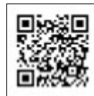
申請ページQRコード